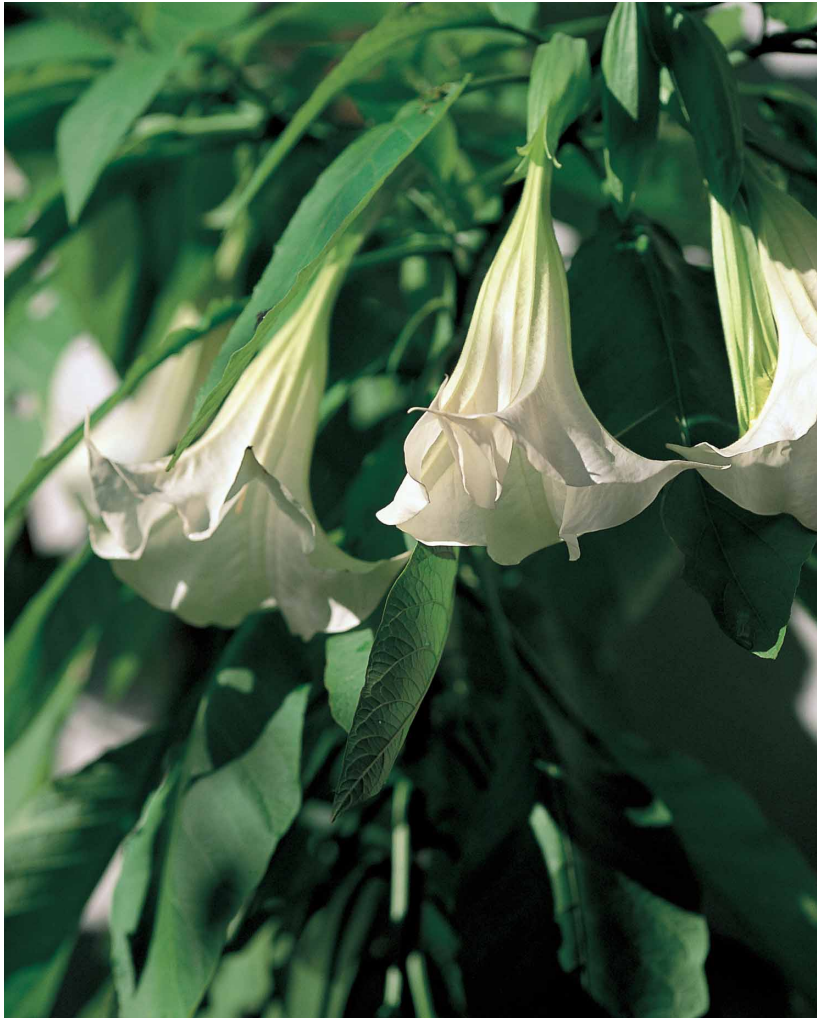
トランペットフラワー